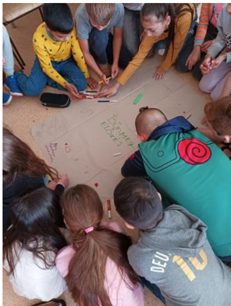
Bűnmegelőzés – foglalkozás az 5. a-ban