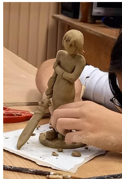
Egy kis szobrászkodás a művészeti iskolában