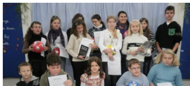
A nyelvi hét jutalmazottjai